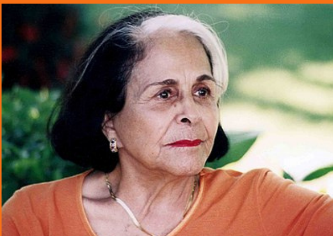
Једна од четири Мирабал сестре, Деде, једина која није убијена у атентату 1960. године.

Сестре Мирабел постале су симбол националног и феминистичког отпора.